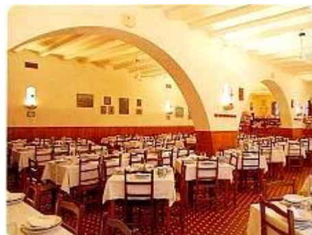
il Refettorio del Pellegrino