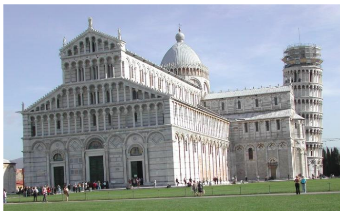
Pisa Duomo e Torre