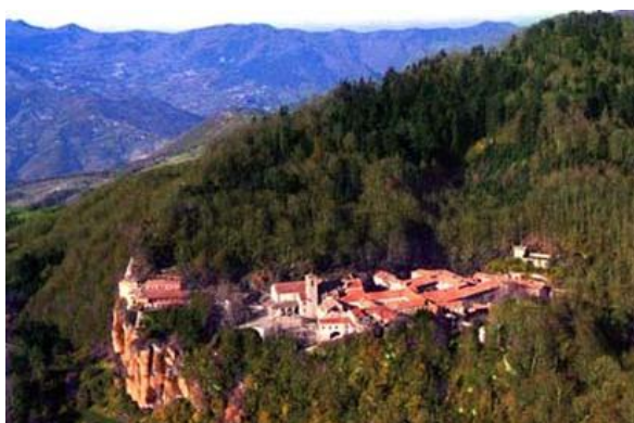
Santuario della Verna mt. 1.128