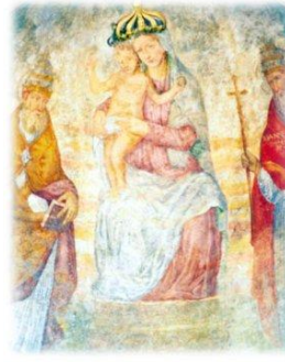
l'Affresco di 2 mt XV' sec